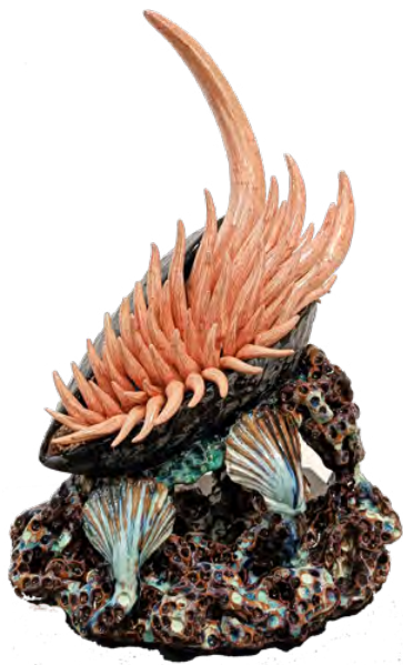
J.-P. Racca-Vammerisse Mytulus Voracephale, 2023 Céramique émaillée polychrome, Faïence & grès, 33 x 43 x 23 cm