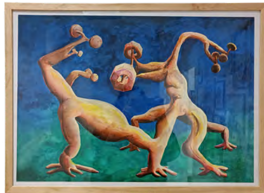
Jérémy Griffaud, Enlarge yourself, 2022 Aquarelle sur papier, 50 x 70 cm