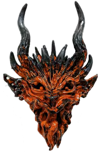
J.-P. Racca-Vammerisse, Magma love, 2023 Céramique murale émaillée polychrome, Faïence, 33 x 48 x 17 cm