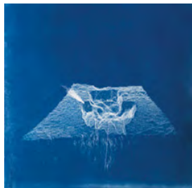
Églé Vismanté, Fantômes de pierre, 2023 cyanotype, 25 x 25 cm