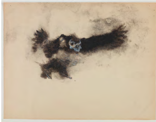
Jean-Luc Verna, Le dépit amoureux, 2017 Transfert de dessin sur papier rehaussé de crayon, 23,8 x 30,3 cm, cadre 45 x 52 cm