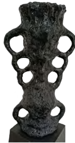
J.-P. Racca-Vammerisse, Noir Aphone, 2023 Céramique boursoufflée monochrome, Terre mêlée, 43 x 25x 15 cm