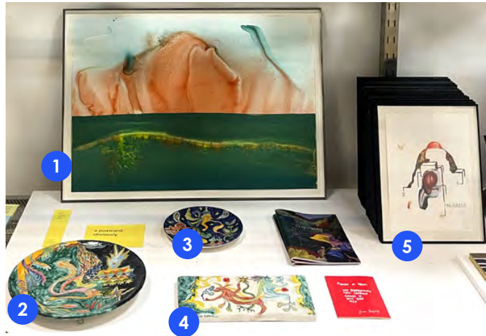
1. Alice Gauthier, Sous l'horizon II, 2023 Gouache et encre sur papier, 50 x 70 cm