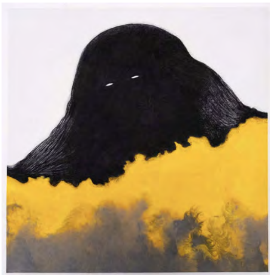
● Alice Gauthier, Regardés III, 2023 Pierre noire et encre sur papier marouffé sur toile, 91 x 91 cm