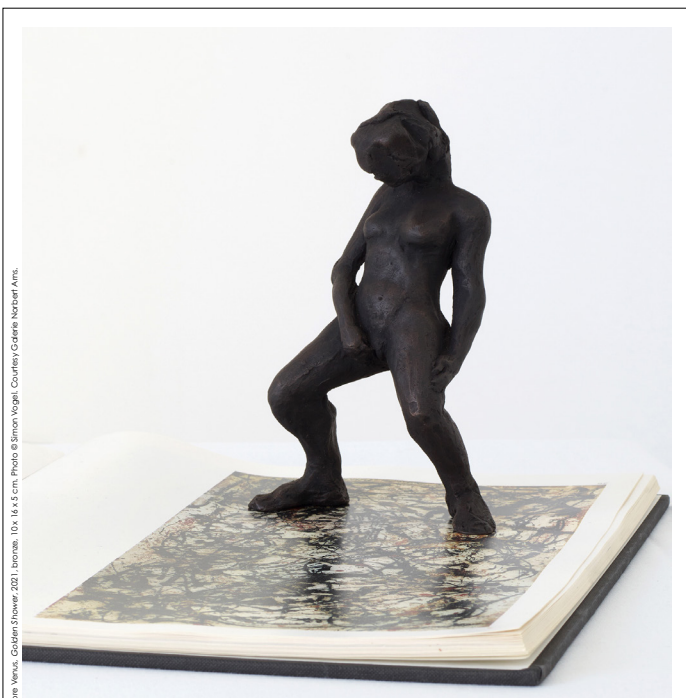
Sore Venus, Galerie Shower, 2021, bronze, 10x, 14 x 5 cm, Photo © Simon Vogel, Courtesy Galerie Harbarth Arts.